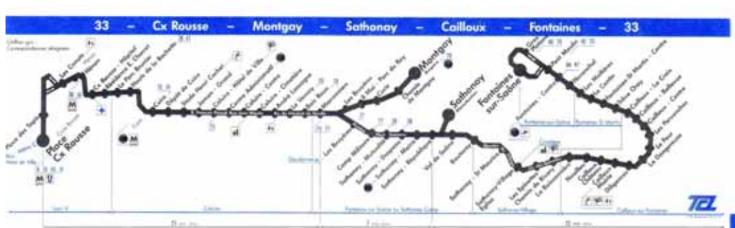
La ligne 33 en 1991 avec sa branche Fontaines par Cailloux