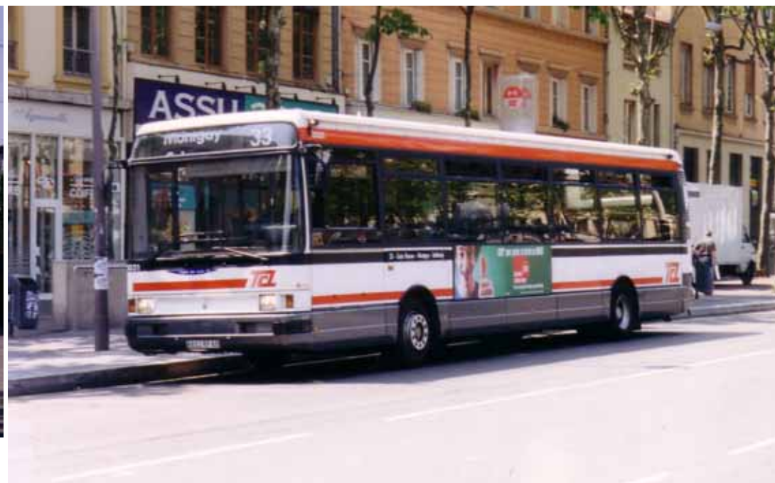
3031 vu place Croix Rousse