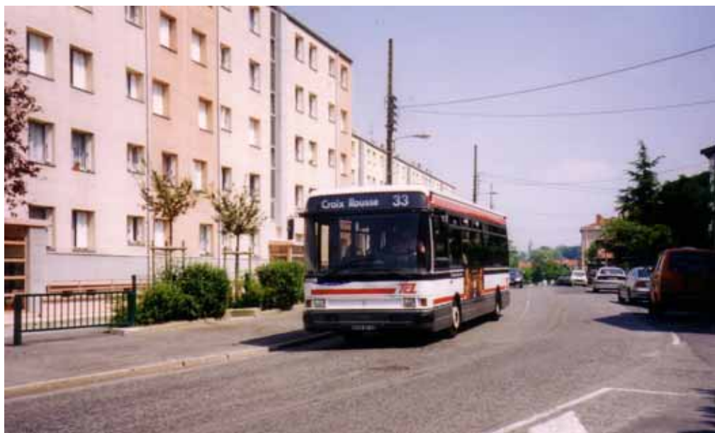
3028 vu à Sathonay Mutualité