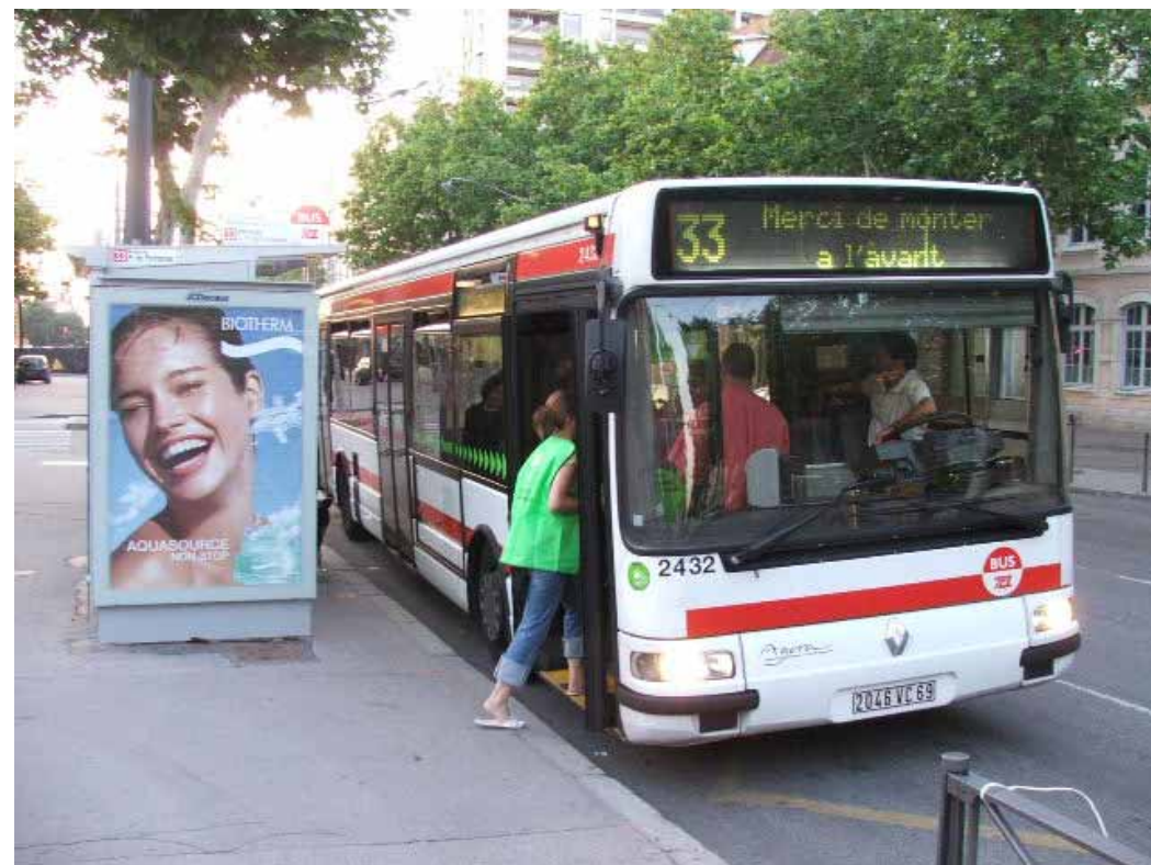
Le Mag n°43 - Décembre 2006