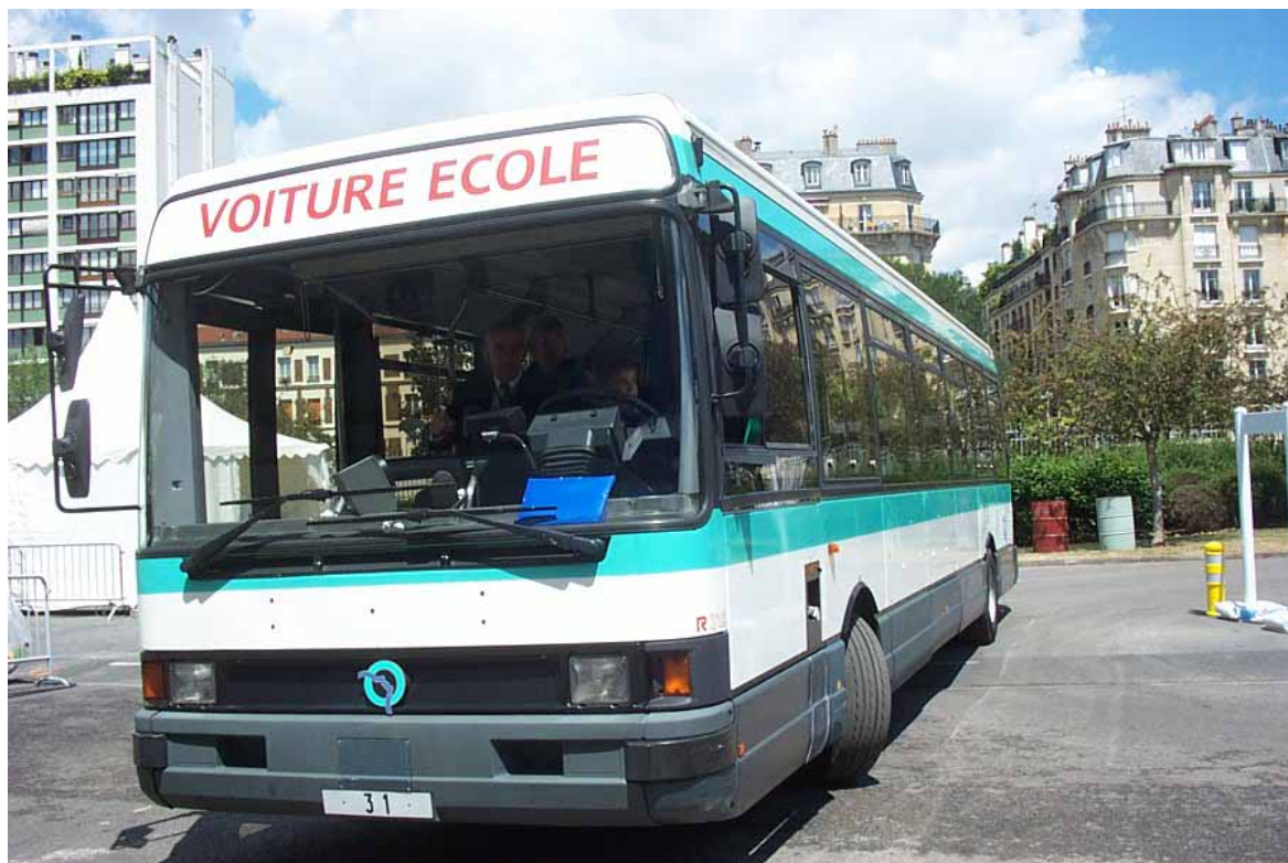
Notre petit tour de R312 et d'Agora S s'est bien terminé !