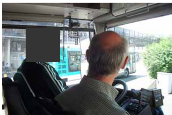
Ci-dessus, notre ami SP98 !