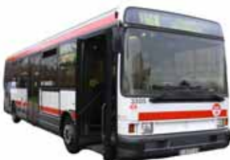
R312 de la ligne 15