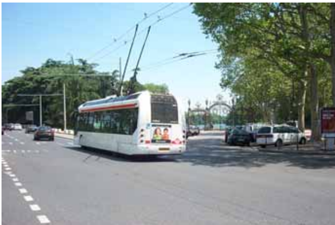
ETB12 devant le Parc de la Tête d'Or