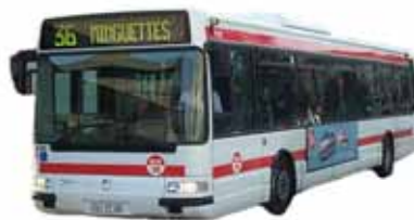
Agora Line series 1200,1300 et 1400