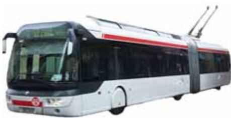
Cristalis ETB12 et 18

Voici les véhicules qui sont munis d'une climatisation sur le réseau TCL :